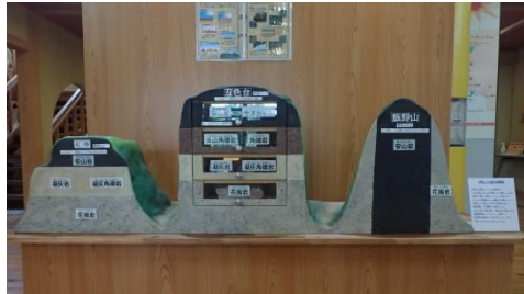
五色台の地形・地質コーナー