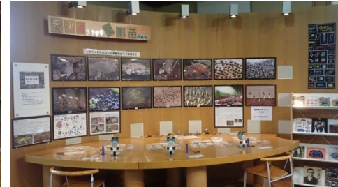
四国(たぶん)の変形菌展示

スタッフが常駐していますので、気になることやご質問があればご遠慮なく声をかけてくださいね。