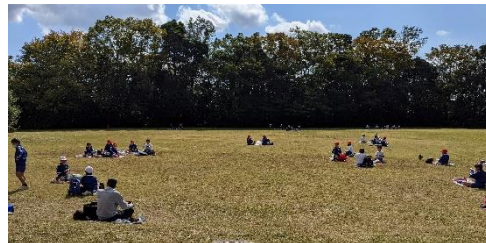
森に囲まれた広い園地でのびのびと！